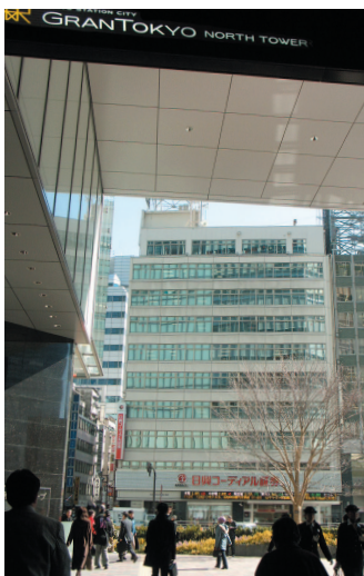
事務局が入る八重洲口会館(正面ビル)